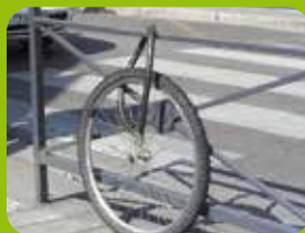
Cadre non attaché