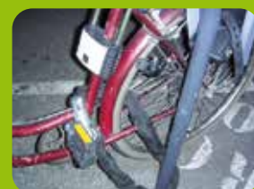
Antivol traînant à terre