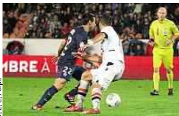
J. E. E. / Spira

La L1 prépare-t-elle mal le PSG aux défis européens? P.20