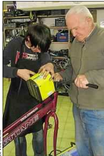
Lors de la formation au gravage.

Jusqu'au 25 avril, grâce à une machine prêtée par la fac, l'association propose un atelier gratuit de gravage pour les